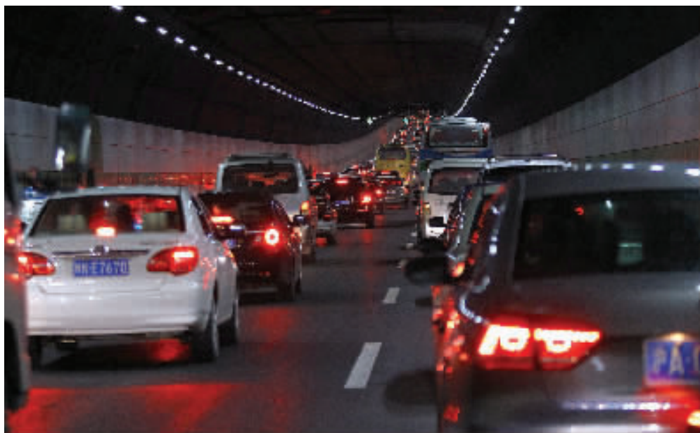
从市区到崇明的长江隧桥逢节假日易出现拥堵。