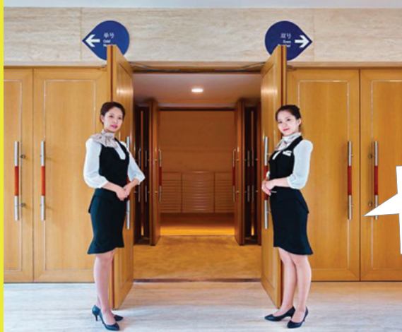
音乐厅礼宾员。 资料图

“薪酬不是大问题。在音乐厅工作，我主要看重良好环境以及未来艺术产业的发展空间。”