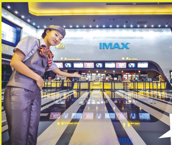
电影院检票员。 资料图

“做电影检票员以来，我有很多的岗位收获，除了性格的修炼，对于电影也更加了解和热爱了，这份工作值得长期坚守。”