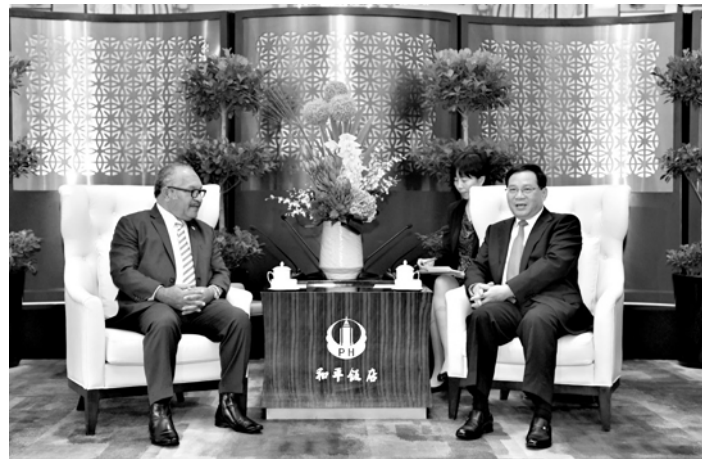
李强会见巴布亚新几内亚总理奥尼尔。

李强代表上海市委、市政府和全市人民对总理阁下来沪访问表示热烈欢迎。他说,巴布亚新几内亚是中国在太平洋岛国地区的好朋友、好伙伴。2014年习近平主席同总理阁下来就建立战略伙伴关系达成共识以来,两国关系进入发展快车道。您此次访华,必将有助于深化双边关系发展,更好造福两国人民。上海是中国最大的经济中心城市,当前正在加快建设国际经济、金融、贸易、航运、科技创新中心,卓越的全球城市和具有世界影响力的社会主义现代化国际大都市。近年来,上海与巴新交流合作日益密切,双方经济结构具有较强的互补性。希望进一步发挥各自优势,分享经验做法,扩大人员往来,拓展经贸合作,在旅游、渔业、人文等领域加强