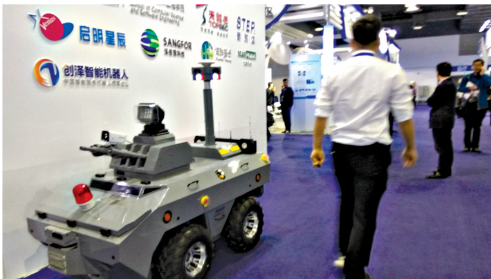
排爆车成居民区无人安防巡逻车。