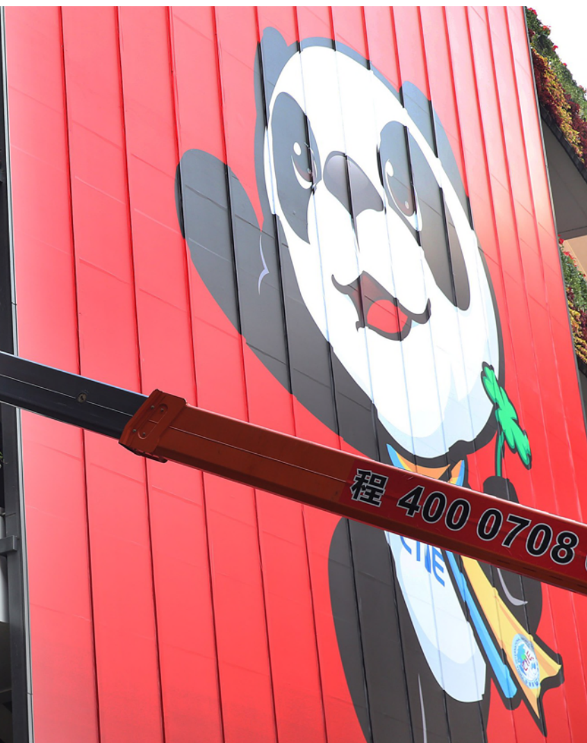
各展馆正在进行最后的装饰工作。