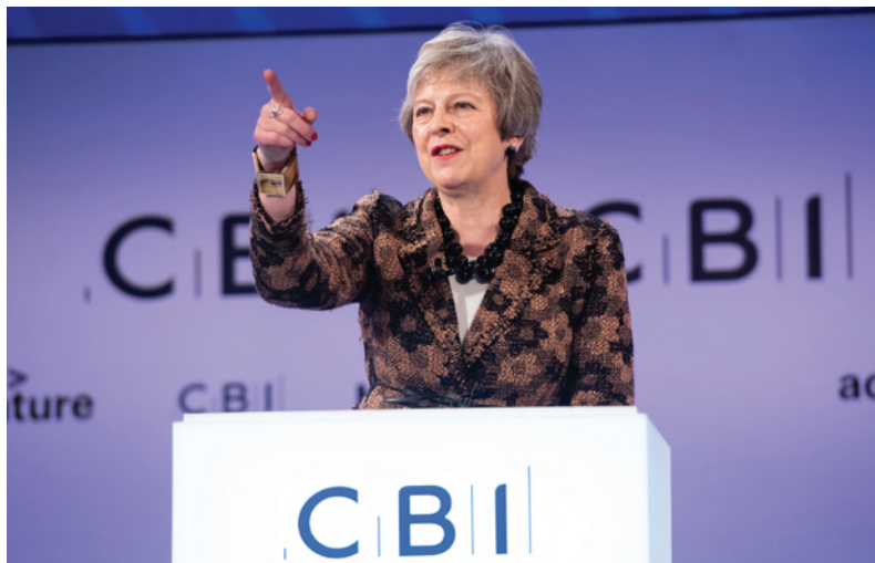
特雷莎·梅在英国工业联合会年会上发表演讲。