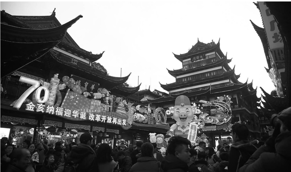
大年初一，游客在豫园赏灯。

豫园方面提醒：因灯会周围停车位有限，建议观灯游客选择绿色出行，参观灯会主题文化活动的游客可享受BFC外滩金融中心的限时免费停车服务。