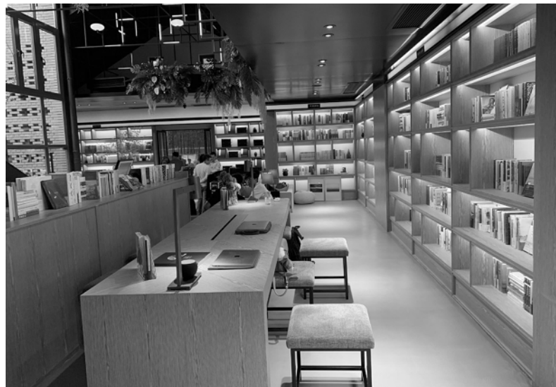
“华东师范大学校园书吧”在中山北路校区启用。