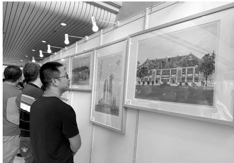
复旦校园建筑主题作品展在逸夫科技楼开幕。

老校门、相辉堂、光华楼……复旦建筑覆上一层水墨写意后会呈现怎样一种美丽？一流的大学必须有一流的读书空间，华师大在丽娃河畔点亮又一盏“阅读之灯”。