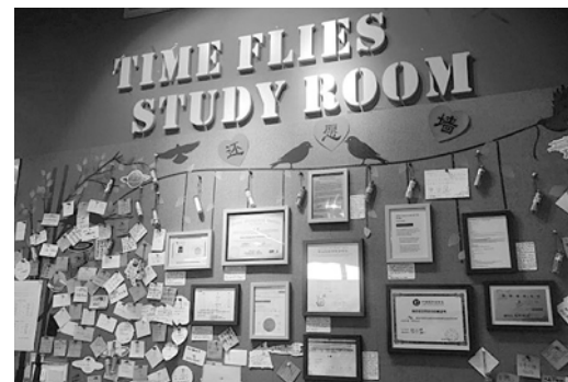
自习室里的许愿墙。