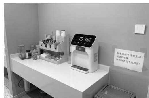
累了可以喝点咖啡。