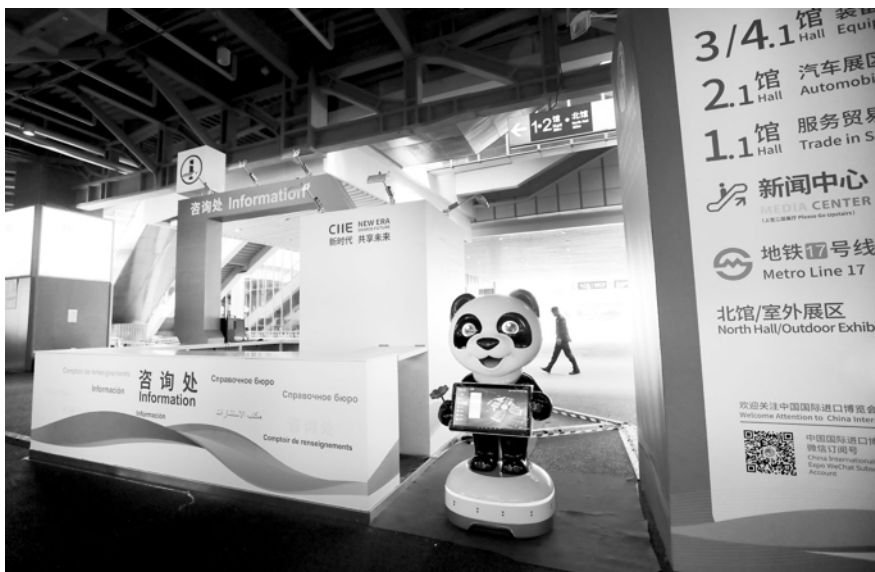
“进宝机器人”会自动识别人物并就展区信息情况提供咨询问答。