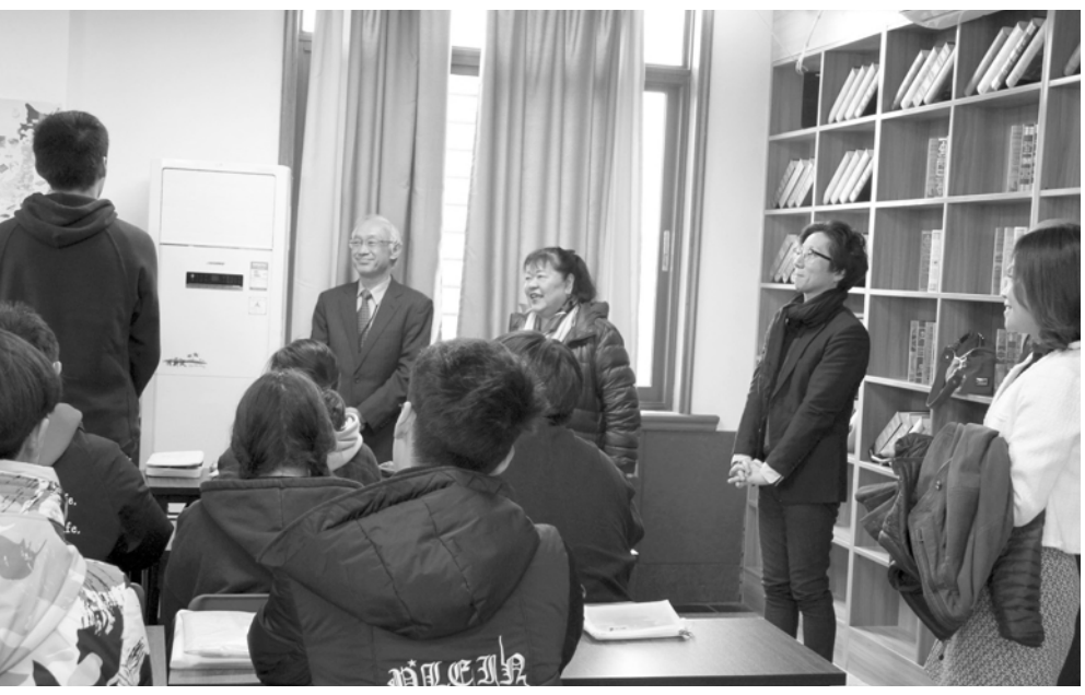
访问团参观了朝阳义塾校区。

日前，由朝阳国际、朝日留学、上海朝阳义塾日本国际高中联合主办的“2020中日高中国际教育论坛”在上海朝阳义塾礼堂召开。来自日本五所高校的访问团一行到达朝阳义塾，进行了访问交流。