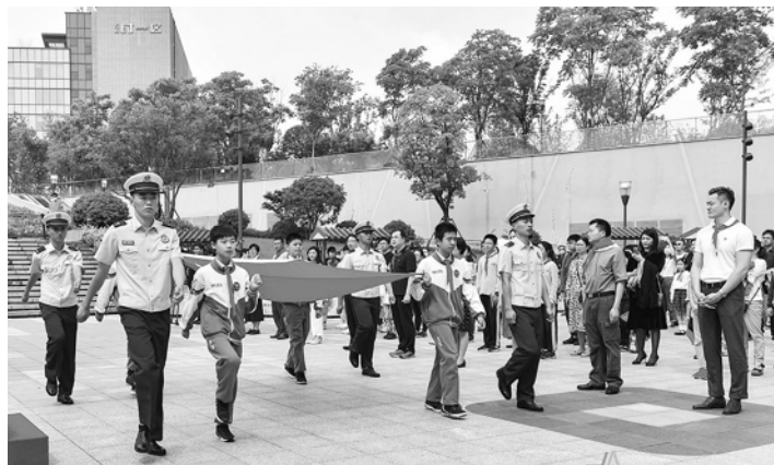
“国旗下成长”闵行青少年升旗仪式昨日举行。