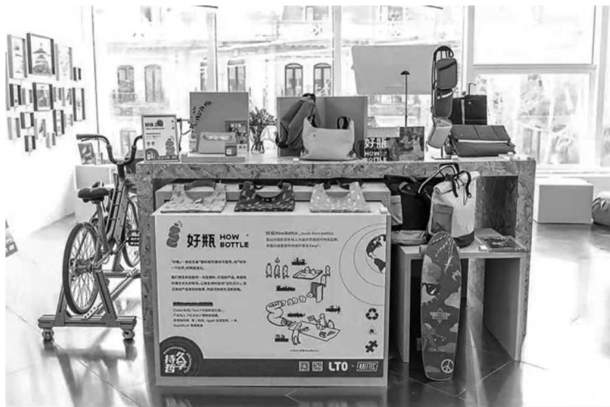
这里展示的产品都是利用废弃材料进行再制,让它们获得新的生命,减少更多垃圾产生。