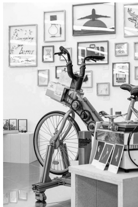
快闪店的每一件产品都在无声地向人们倡导着环保的理念。