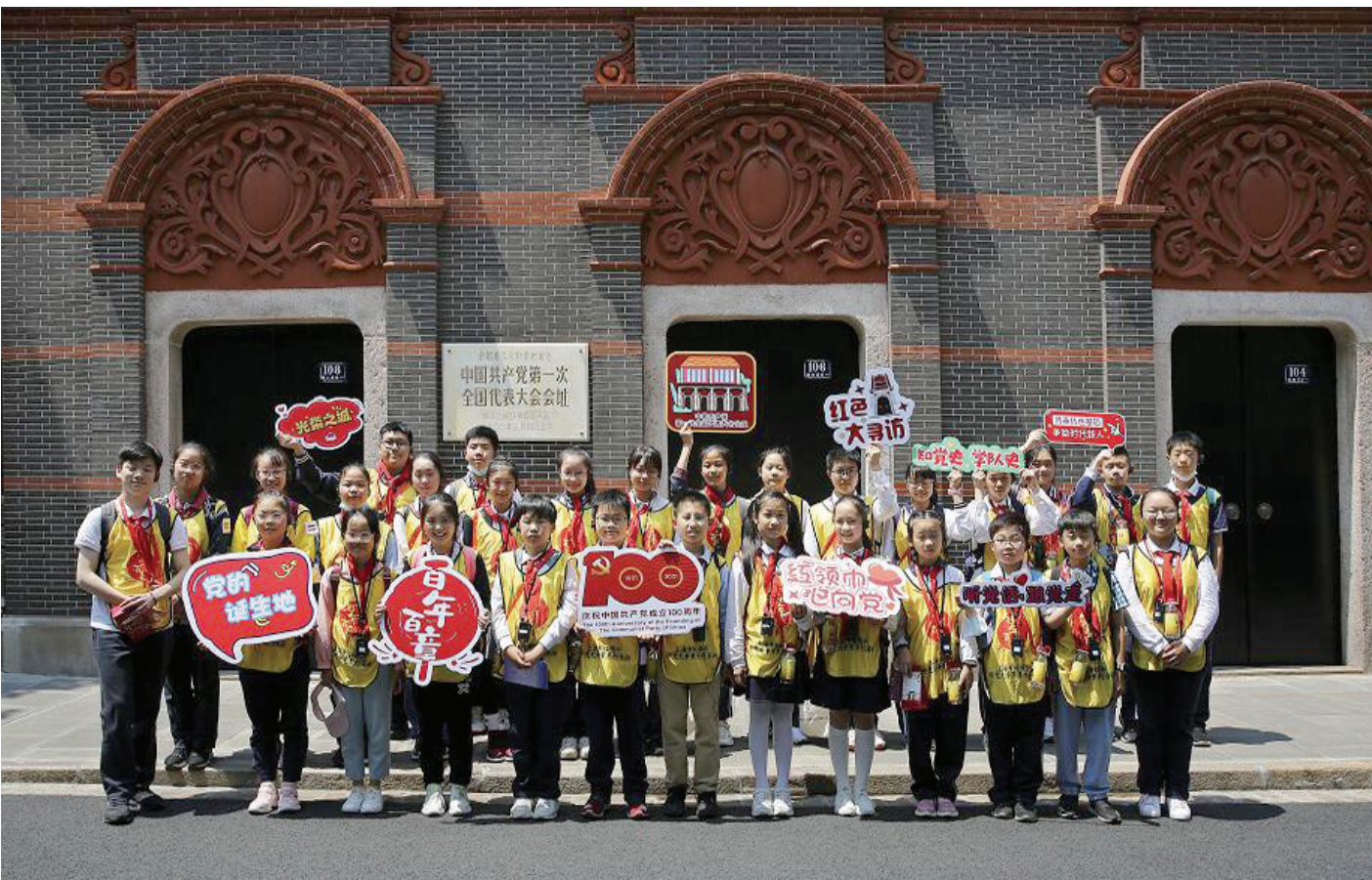
上海少先队员在深入开展党史学习教育中丰富学习内容,创新形式载体,“开门学党史”。

“历史足迹我来寻”是杨浦区少工委、区红领巾理事会发布的六大专项行动之一,依托“百年百章”上海市红领巾学党史争章地图,可以打卡上海、杨浦的红色地标,比如秦皇岛码头(黄浦码头旧址)、《共产党宣言》展示馆、临青学校旧址、杨树浦发电厂等。建设小学的队员们在临青学校旧址感受当年“生长在炮火下”的孩子,在党的领导下展现了“少年强则中国强”的青春力量。未来,更多的红色研学线路将被设计开发。