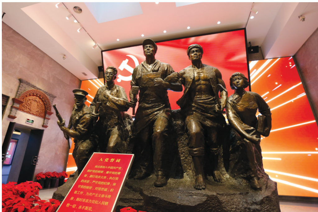
重新开馆的中共四大纪念馆,加入了众多多媒体互动技术。

据了解,在满足观众传统图文式参观体验的基础上,纪念馆进一步融入多媒体互动技术,打造“智慧”场馆,如:AR增强现实技术、多媒体投影动态展示、图像识别、一键切换、雷达互动捕捉等技术,更好地提升观展互动性、参与性、趣味性。