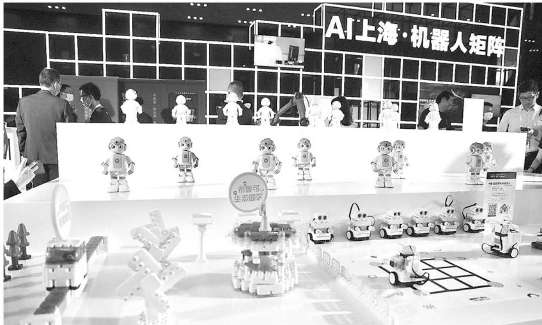
2020世界人工智能大会的展品。

云会场打造全三维会议大厅,可以让“云观众”身临其境观看大会直播,实现与现场嘉宾实时互动,并提供变装、选座、人物塑造、场景设计、多语种同传等体验。除了开幕式外,今年还有产业、科学、开源、智能驾驶等8个论坛云会场。云展览将2020年“3D虚拟AI家园”进行迭代升级,对于参展企业,实现企业展示、精准投放等功能;对于参会观众,增加视频瀑布流等创新体验,强化线上线下交互体验。