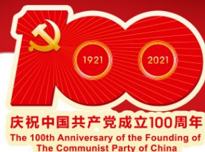
庆祝中国共产党成立100周年 The 100th Anniversary of the Founding of The Communist Party of China