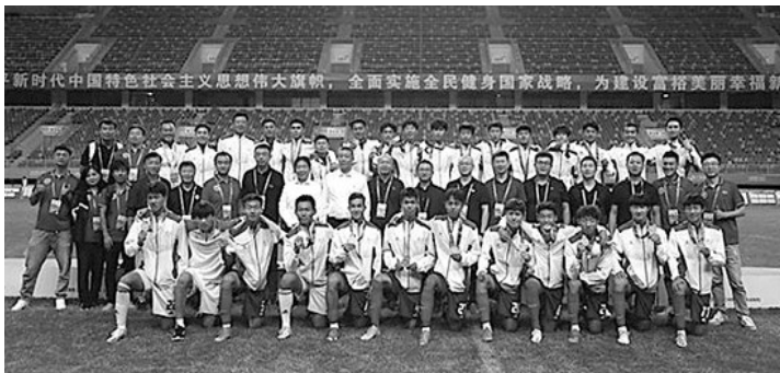
这次冠军队的班底就是海港青训梯队。