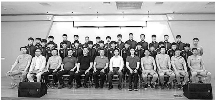
上海U18由于赛制改变爆冷输给了浙江,无缘这次的全运会正赛。