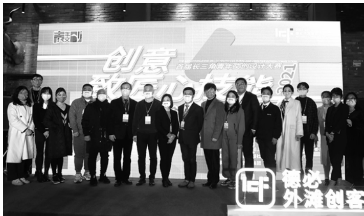
2021年青年文创大赛德必成果分享会举办。