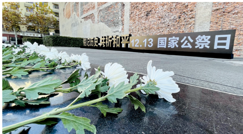
上海四行仓库抗战纪念馆广场上有市民自发前来悼念。