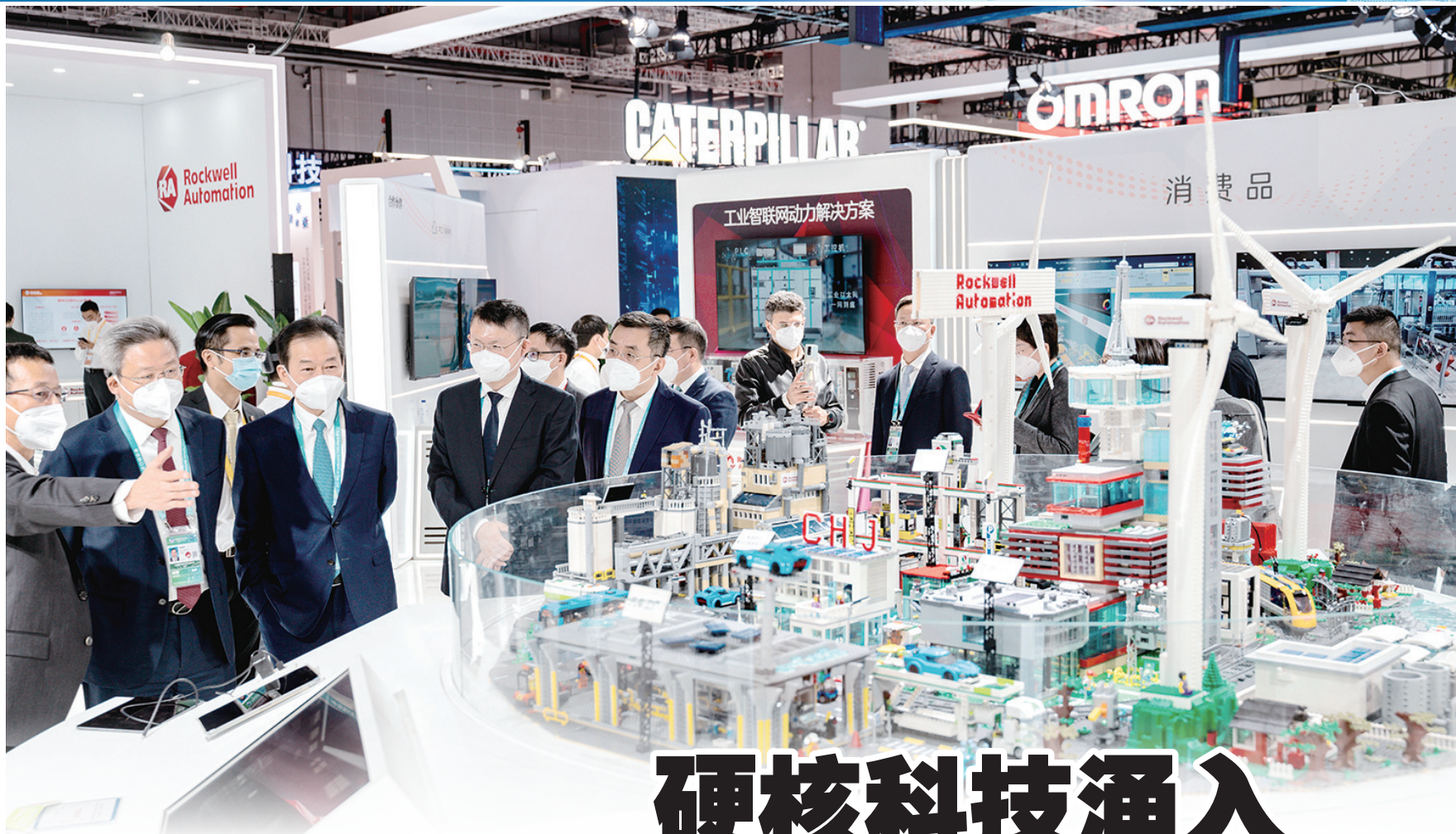
乐高搭建的智慧园区中有风车发电、智慧水务、绿色低碳办公楼。