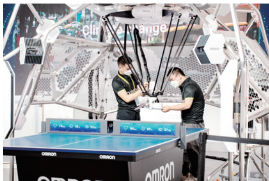
与人互动的“乒乓球机器人”。