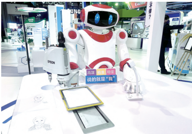
只需三分钟，机器人便能画出一张人像。