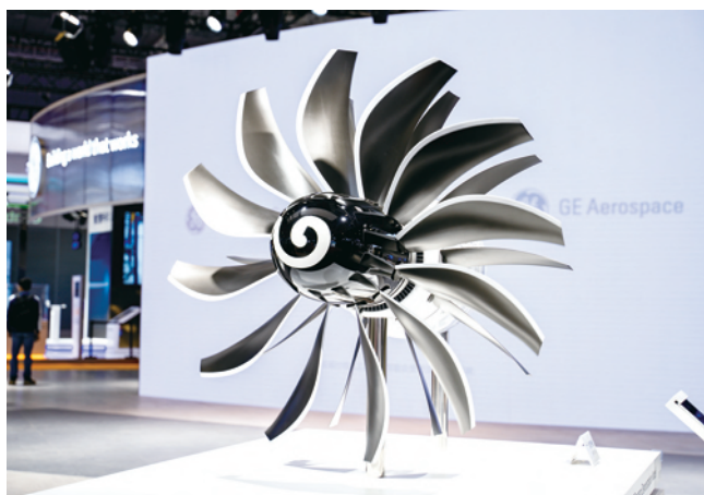
“可持续发动机的革命性创新技术验证项目(rise)”概念模型。