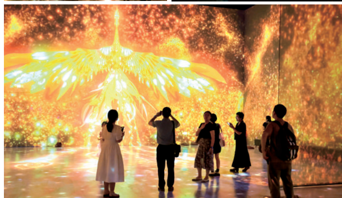
技术进步让人们得以用更多方式了解文物。