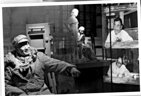
在上海电影博物馆感受上海电影的辉煌历程。

如果你希望再降低些观展的成本，或者用差不多的价格多看几个展，那么，正在热销的“魔都文艺通票”就是你的不二选择。花99元，差不多一个场馆的门票价钱，看遍上海36家知名艺术场馆。