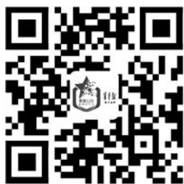
扫码购买 2023 青春上海魔都文艺通票