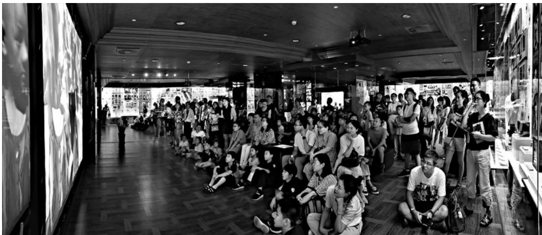
观众沉浸在光影记忆中。

“水银灯下的南京路”几乎实景还原了《马路天使》这一经典影片中的拍摄场景，再现了包括沪江照相馆、永安百货公司橱窗、飞达咖啡馆等著名商家在内的一组上海昔日街景，带领参观者穿越时光，近距离体验上海电影中出现的都市繁华和迷人风韵。“百年发行放映”展区透过模型、广告及百余幅各个历史时期的海报，回顾发行放映的百年历史，展示上海电影长盛不衰的文化魅力。在这部分可以看到很多以前手绘的电影海报，喜欢看电影的观众，在这里一定会看到不少熟悉的作品，说不定还能勾起与某部电影有关的回忆。除了海报，这里还展示了不少珍贵的电影杂志，如1950年6月发行的中国最有代表性的电影期刊《大众电影》创刊号、1949年后出版的《电影故事》杂志、1934年出版的《良友》电影专刊、1950年出版的第一期《青春电影》杂志等。