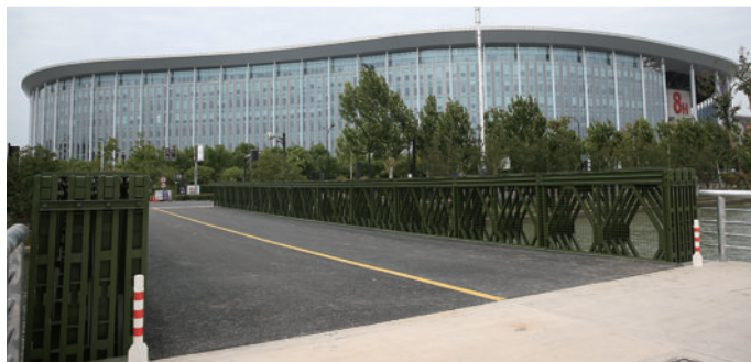
本届进博会周边共设临时停车场19处。

边共设临时停车场19处,可提供大客车泊位约1000个,小客车泊位约1900个,虹桥商务区核心区内共享停车场,在工作日可提供小车位约4000个,非工作日提供约7000个。经过各相关部门协调挖潜,恢复P3、P4停车场功能,新建P25远端停车场,增设蟠龙天地5号停车场供小客车停泊。同时,新建P7跨小涑港钢便桥出入口,新建P15南侧人行钢便桥,多措并举做好进博会保障工作,为展客商提供便利。此外,P8、P15停车场、华翔路社会车辆临时下客点作为“即停即走”停车场。