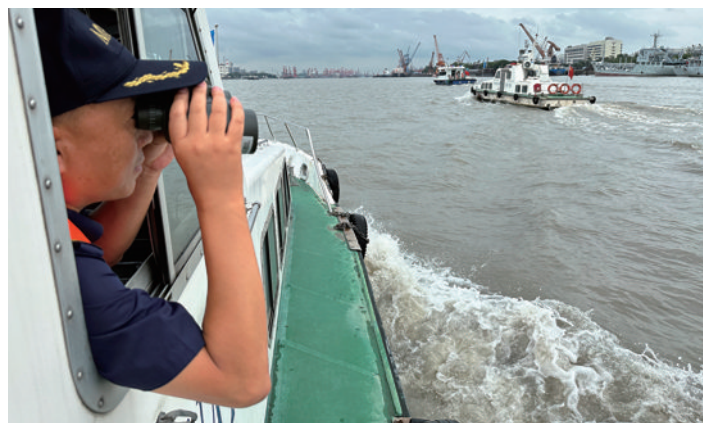
多部门联合开展黄浦江水域通航安全整治联合执法行动。

三方执法力量采用高频宣传、分段检查、拉网排查、重点筛查等方式,重点查处未开启AIS(船舶自动识别系统)、未按规定保持船容船貌、船舶配员、防尘遮盖、擅自排放洗舱水等违法违规行。