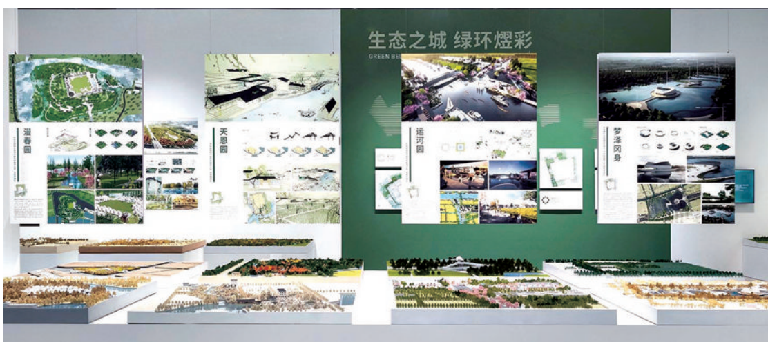
新城的未来生活绿意盎然。

一个个设计方案，一张张充满诗情画意的设计图纸，都在告诉我们，未来的上海新城，不仅有生活，还有诗和远方。