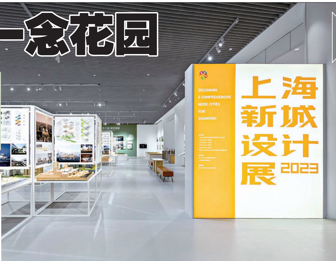
《2023上海新城设计展》在上海城市规划展示馆开幕。