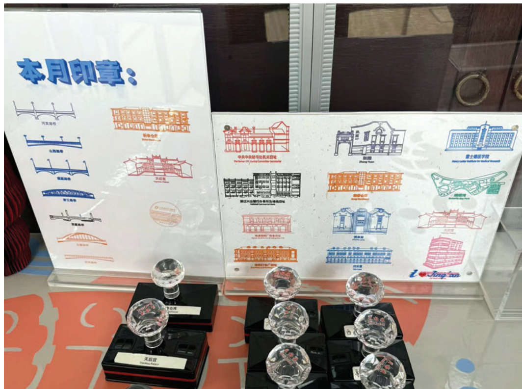
静安旅游服务中心盖章。