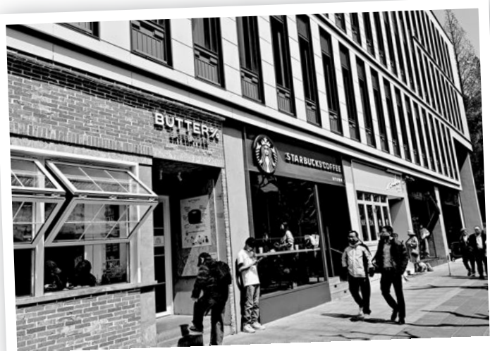
“新象限·武夷”的沿街店铺。

表示,这一地块想要打造精彩生活的舞台和创意生态的平台。建立无界社区,与街道融合,形成无障碍感的项目入口与城市漫步穿越路线。推出“艺游武夷”,在公共空间添加艺术元素,打破传统办公与商业的功能界限,以文化为核心,吸引更多人来打卡。在创意生态平台方面,不仅会引入首店经济,还会引入有知名度的文创企业作为文化标签与引领,带动产业孵化发展。“同时也会在空间里周期性举办艺术主题展演,让更多艺术家、策展人等走进武夷路,对话研讨,共创未来。”