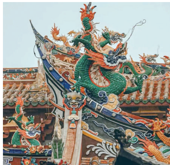
小姜在福建东山岛关帝庙高拍摄的传统雕塑艺术。

人们不再满足于“走马观花”式的到此一游,而是希望在认知层面拓展深度与广度,对古建古迹的深入探访,也成为他们拓宽视野、增益见识的一种重要方式。