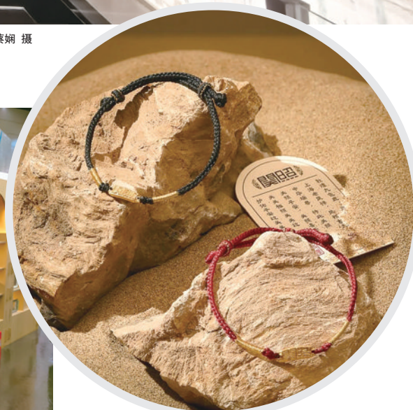
“何以敦煌”文创产品“关照”手绳。

作品,感觉非常震撼。每一幅壁画都像是在讲述一个古老的故事,让人不禁沉醉其中。”旅行团成员对于大展呈现的敦煌艺术独特风格和深厚内涵表示赞叹。