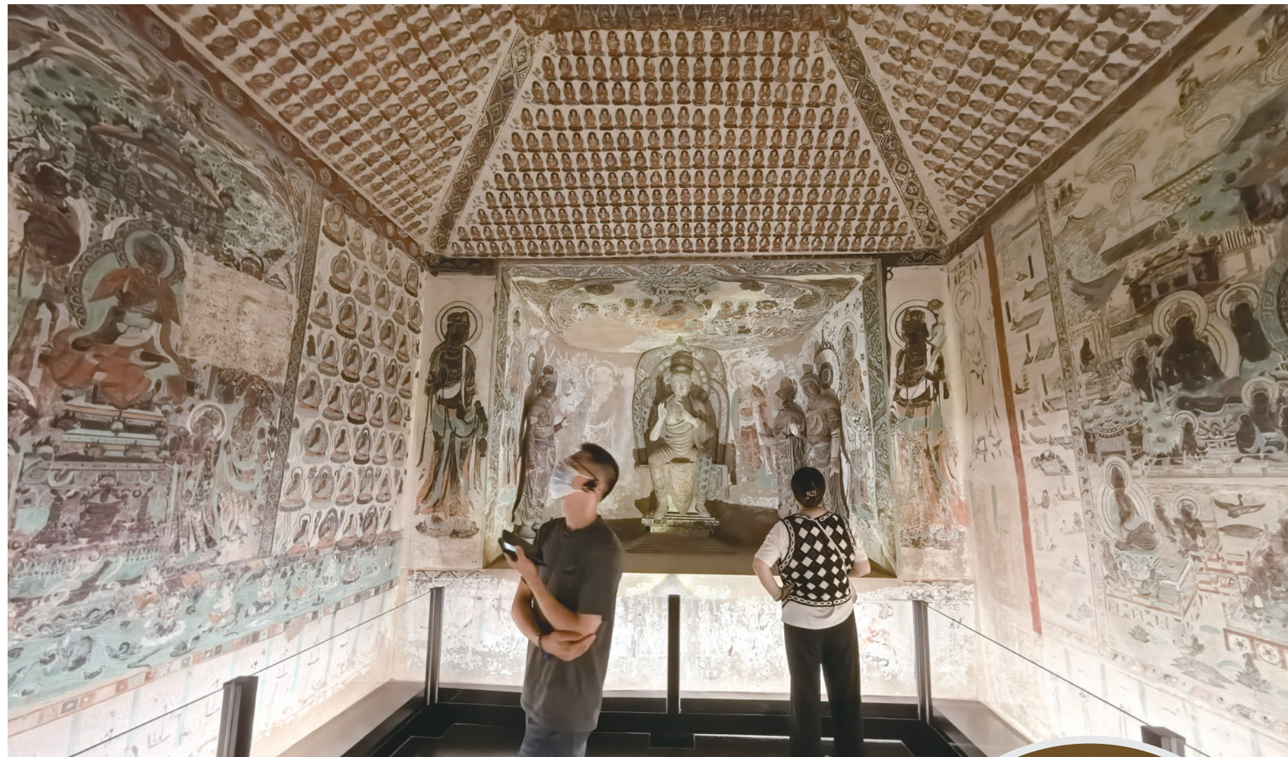
“何以敦煌”艺术展盛唐莫高窟第320窟(复制)。