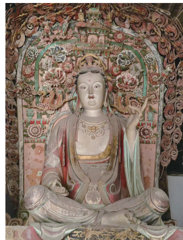
小姜在山西拍摄的文物。

作为深受境外游客喜爱的旅游目的地,敦煌在世界上享有很高的声誉和影响力。而上海旅游节作为上海城市的金名片,同样在世界上具有重要的影响力和知名度,让两大IP进行联动,将彼此助益。“来到上海,在上海看敦煌艺术大展,不仅能让敦煌的优秀传统文化依托上海这个文化大码头得到传承,同时,我们也将借助敦煌的影响力,不断扩大上海旅游节的知名度。这也是我们‘讲好中国故事,讲述上海精彩’的一种重要做法。”李平表示。