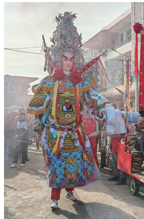
小姜在莆田体验“最长的元宵节”。