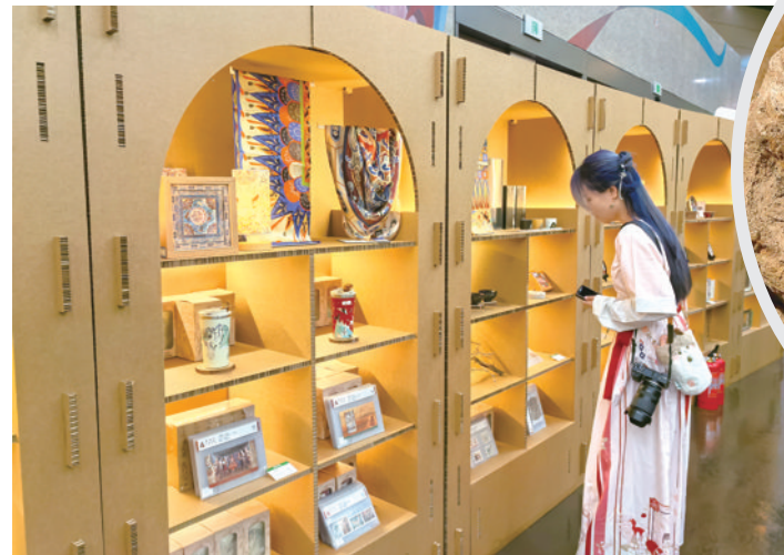
游客参观“何以敦煌”艺术展文创区。

大展开幕首日,一支来自四川的春秋旅行团便到访展览现场,这也是该旅行团到达上海的首日行程。在导游的引导下,团员近距离观赏了敦煌千年文化遗产的魅力。“能够亲眼见到这些平时只能在书本上看到的艺术