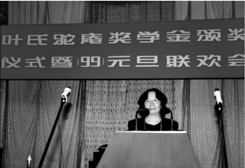
叶嘉莹先生几乎捐献了个人的全部财产，设立了“叶氏驼庵奖学金”“永言学术基金”“迦陵基金”，以推动中国古典文学的研究与传承发展事业。

纪录片拍摄完第一次放给叶嘉莹看的时候，叶嘉莹有一些不同意见，而且比较坚持。李玉华就“斗胆”跟她说，“您也是创作者，如果有人抓着您的手教您怎么写诗，您会愿意吗？”叶嘉莹闻言道，“也是，那就这样吧。”