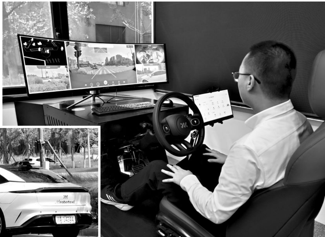
▲安全员在线上时刻关注智能网联出租车的行驶状况。