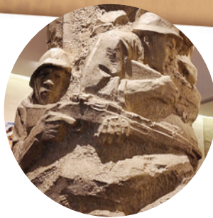
▲上海四行仓库抗战纪念馆内的雕塑。