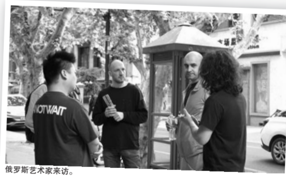
俄罗斯艺术家采访。

如今，这些展览在线上已累计超过1000万传播量，艺术的感染力正穿过街区，先行抵达更远的地方，召唤更多人。