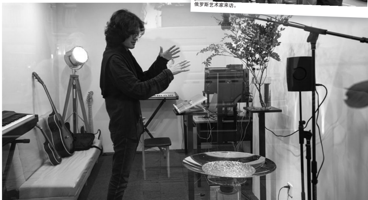
梅卓“听形之声”线下声音工作坊。