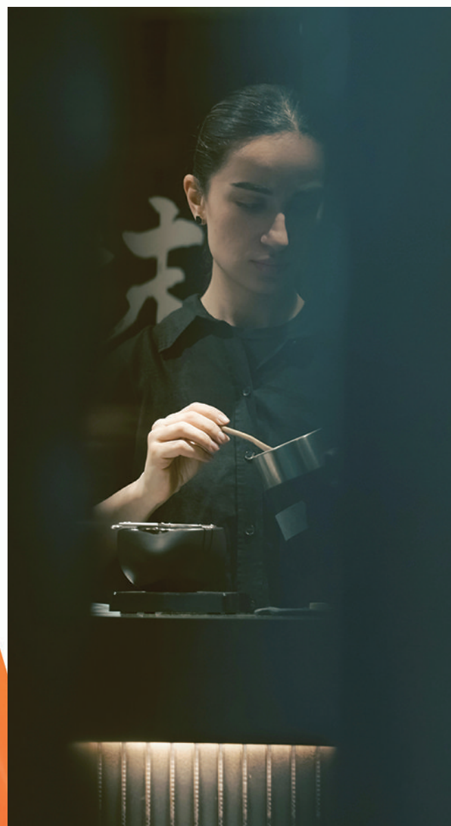
格蕾丝在制作抹茶饮品。

“创业后，我的生活发生了一百八十度的变化，结识的人比起前六年半加起来的还多。”她惊叹。如今，她也成为一名前辈，为跃跃欲试的外国创客提供指导，“昨天我还收到一个外国朋友的创业咨询消息。”与她一样，越来越多的外国人试着登上这个链接全球市场、商业机会无限可能的城市舞台。