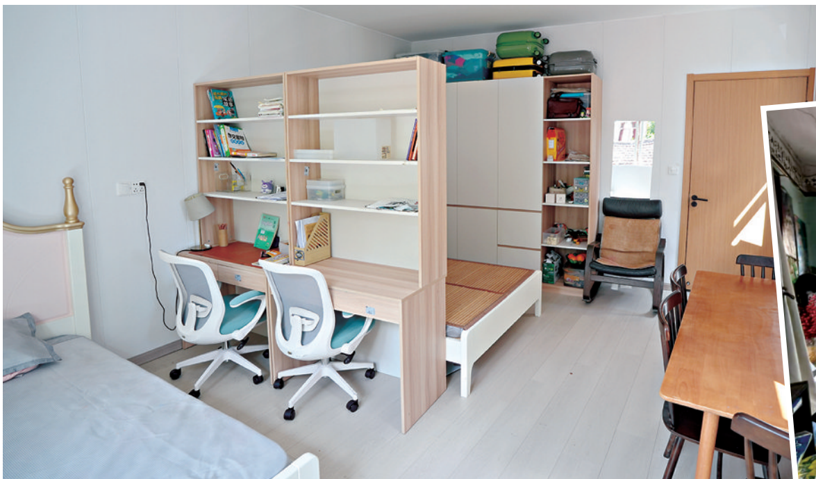
虹口区的小屋改造使原本老旧的房间焕然一新,为姐妹俩提供了明亮、整洁的学习与生活空间。