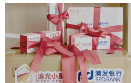
浦发银行捐赠的“成长加油包”。

改造一间房,点亮一颗心,照亮人生路。全市各级团组织协同民政、教育、卫健、公安、妇联等部门和组织,统筹团干部、社工、志愿者等力量,深入摸排困境未成年人生活、学习及身心健康状况,确保资源精准滴灌最需要的群体,托举起成长发展的“大民生”,于方寸之间彰显城市温度。