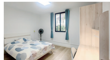
浦东新区的小屋改造彻底焕新,打造出明亮整洁、布局规整的独立空间。

据了解,“追光小屋”施工多安排在暑期,以减少对孩子学习的影响。不少年龄稍大的受助者还会参与爱心暑托班等志愿服务,反哺社会。