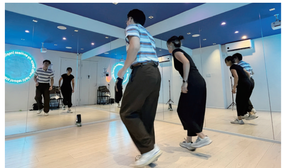
大白和乌拉在舞蹈房排练。