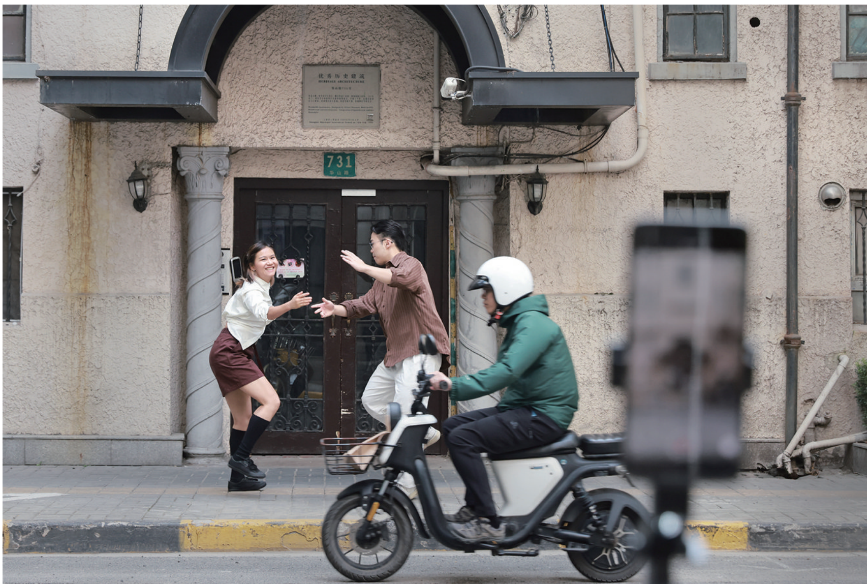
舞者、路与镜头，一起创造了这个“城市舞台”。