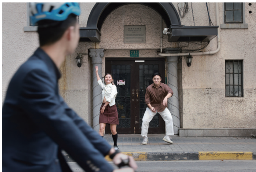
骑车经过的路人不经意间看到了一场街头表演。