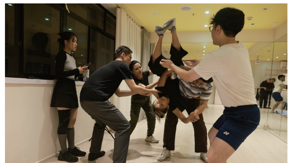
大白和乌拉在同伴的保护下练习高难度动作。