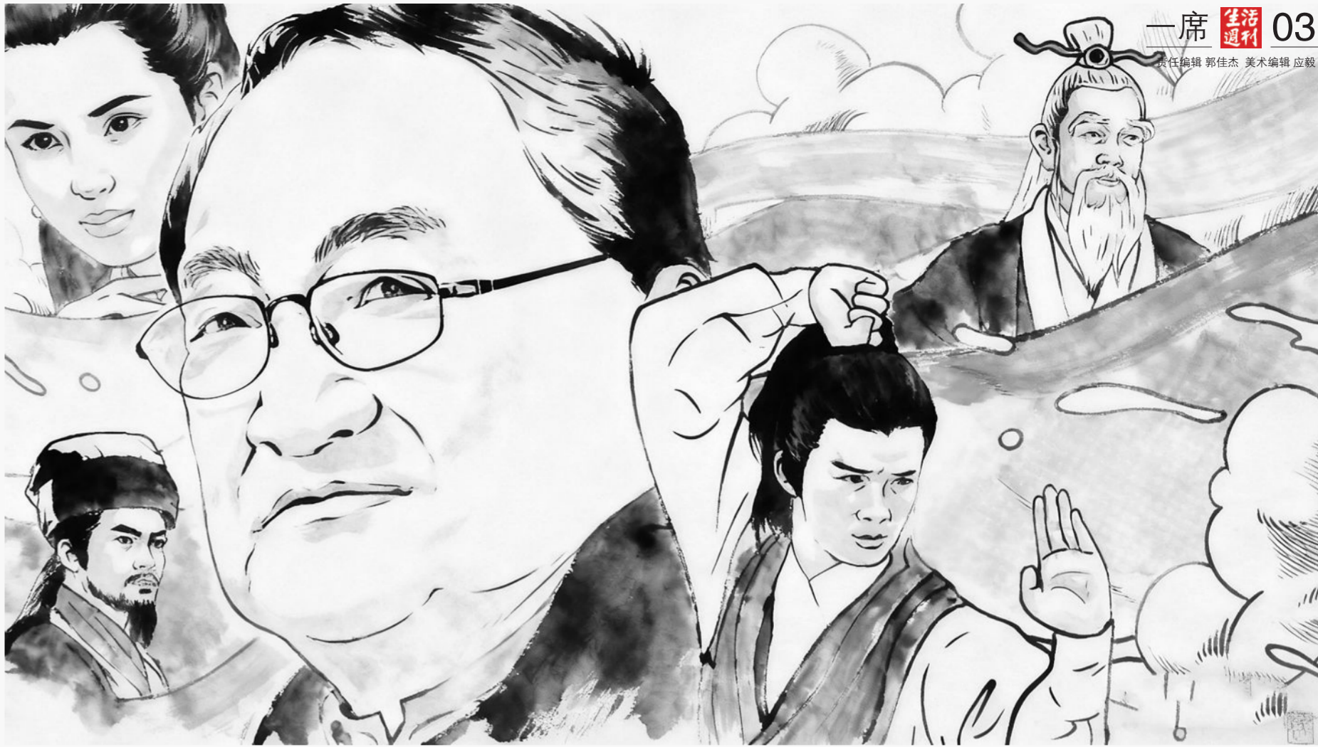
金庸和他的小说人物是一代人的青春记忆。