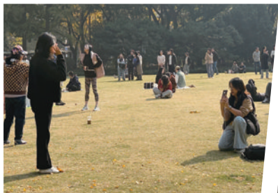
闭园前,静安公园里依旧游客如织。