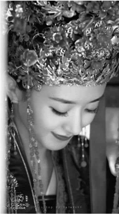
《知否？知否？应是绿肥红瘦》剧照。