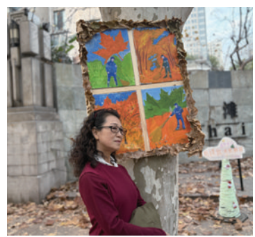
环卫工人把落叶打造成艺术装置。