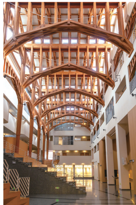
中国传统木构艺术给建筑带来了灵魂。