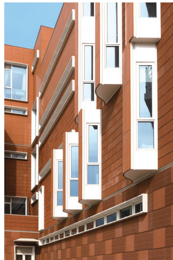
建筑两侧的窄窗引入线形直射光带。

与上海交大设计大楼一同上榜2025“全球最美校园建筑”的还有:英国牛津大学新学院格拉德尔四方院、澳大利亚詹姆斯·库克大学工程与创新中心、丹麦哥本哈根大学尼尔斯·玻尔大楼、西班牙LCl巴塞罗那以及荷兰莱顿大学赫塔·莫尔大楼五所国际著名院校的建筑。