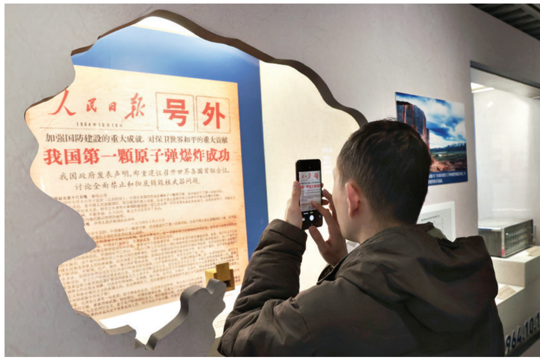
“铸梦金银滩：中国‘两弹一星’辉煌之路”专题展。