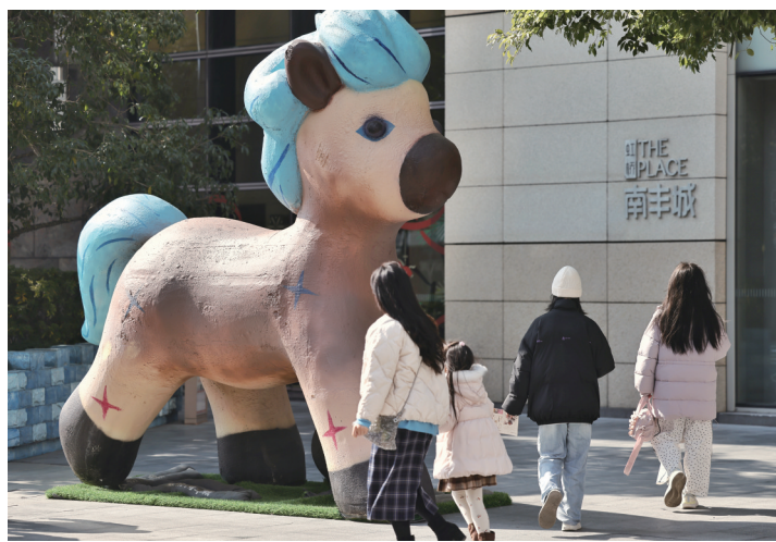
南丰城里年味满满，各种“马”的造型装置吸引众多市民驻足。