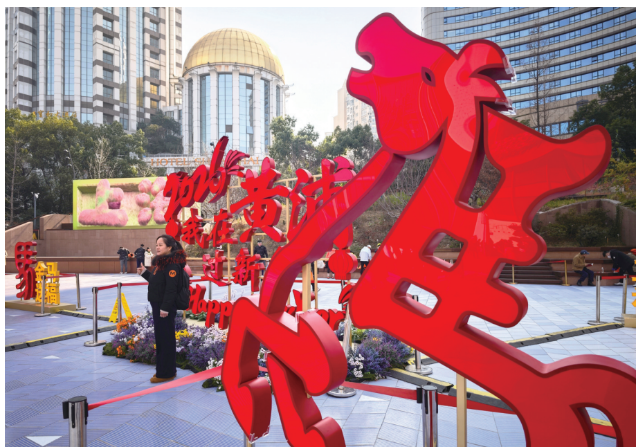
世纪广场上年马年汉字灯组装置，以立体发光“马”字为核心，搭配“马到成功”等吉祥语吸引游客拍照打卡。