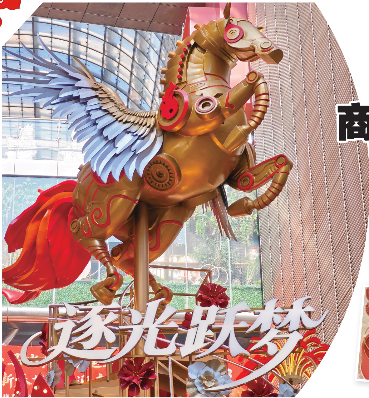
一座名为“逐光跃梦”的大型马年主题雕塑，矗立在南京路步行街上。

来上海，与骏马邂逅！马年新春脚步渐近，“马元素”抢先扮靓申城商圈地标。它们承载着“马到成功”“马上发财”等美好祝愿，为即将到来的新年增添情感温度，为人们送去真挚祝福。