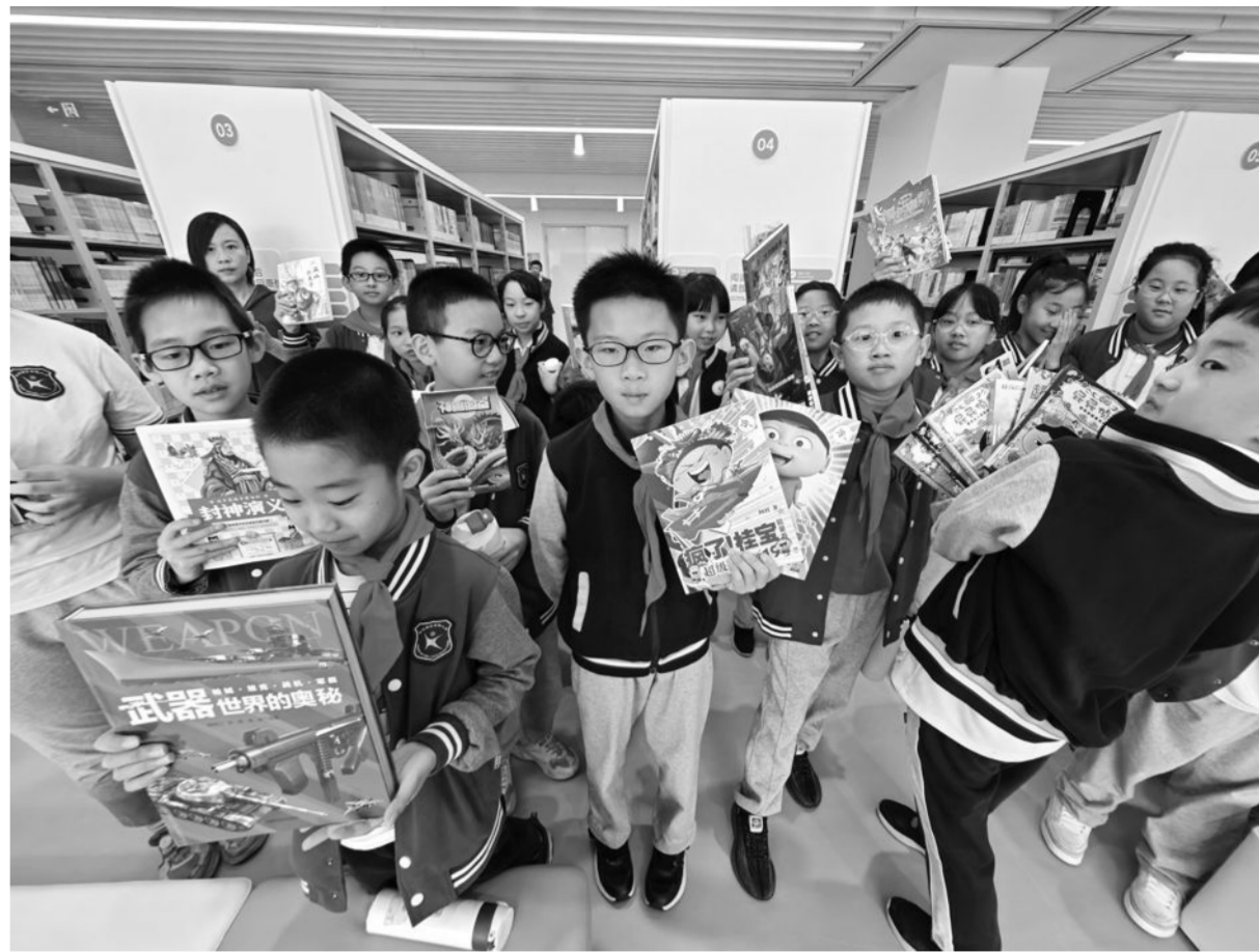
青少年是图书馆的“主力军”。图为浦东图书馆少儿分馆开馆时,小朋友向记者展示借阅的书籍。

值得一提的是,竹居举办的所有活动都免费向公众开放,包括竹居本身,也向居民敞开。“我们其实是把竹居当社区图书馆来打造的,希望它扎根社区,为居民