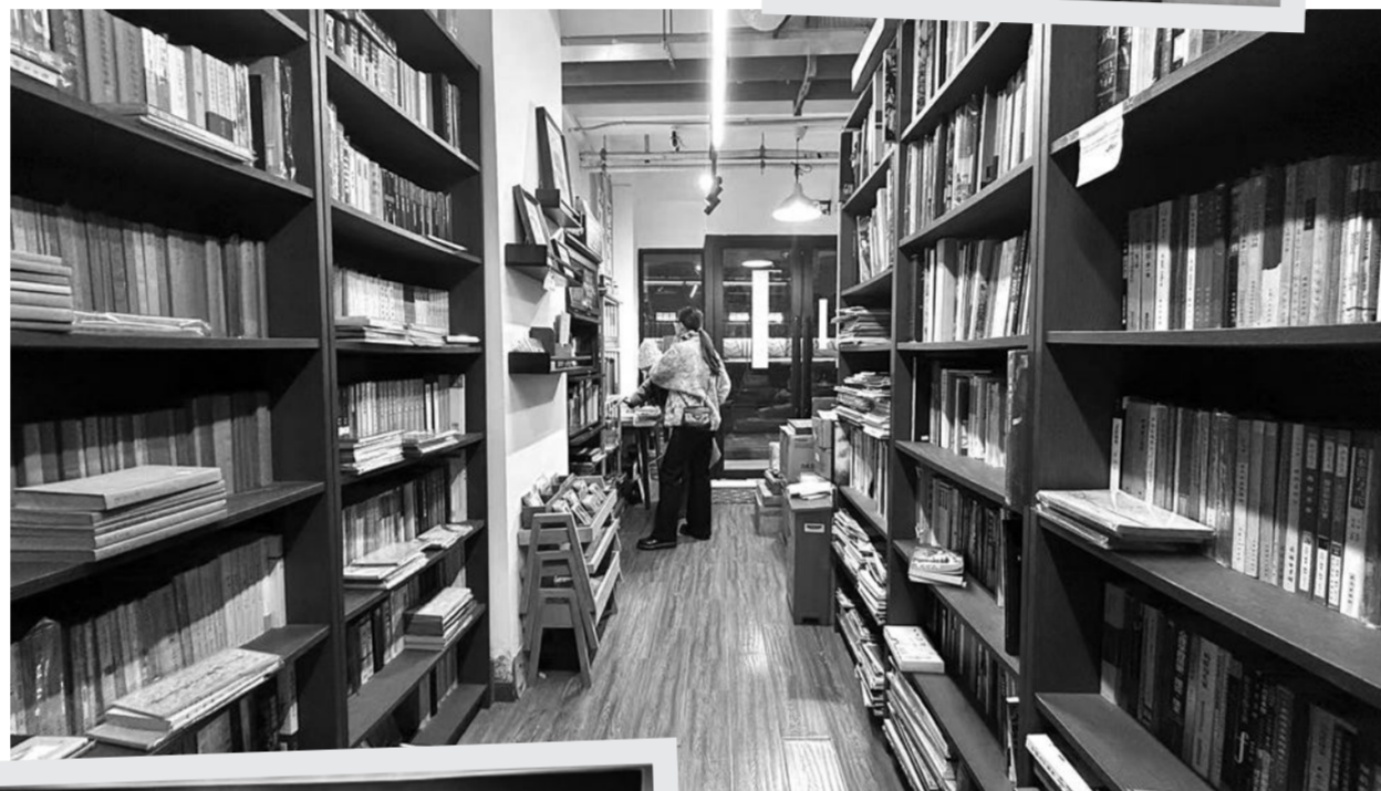
位于苏州河畔的犀牛书店。