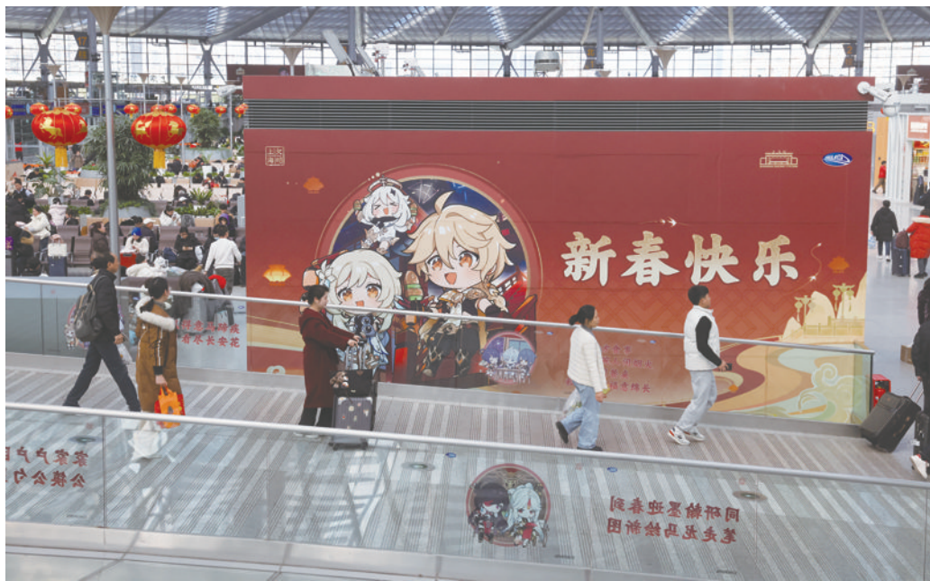
上海南站的墙面上印着《原神》角色形象。

“今年春运,我们上海南站与米哈游游戏共同联动,引入了《原神》的海灯节元素。”上海