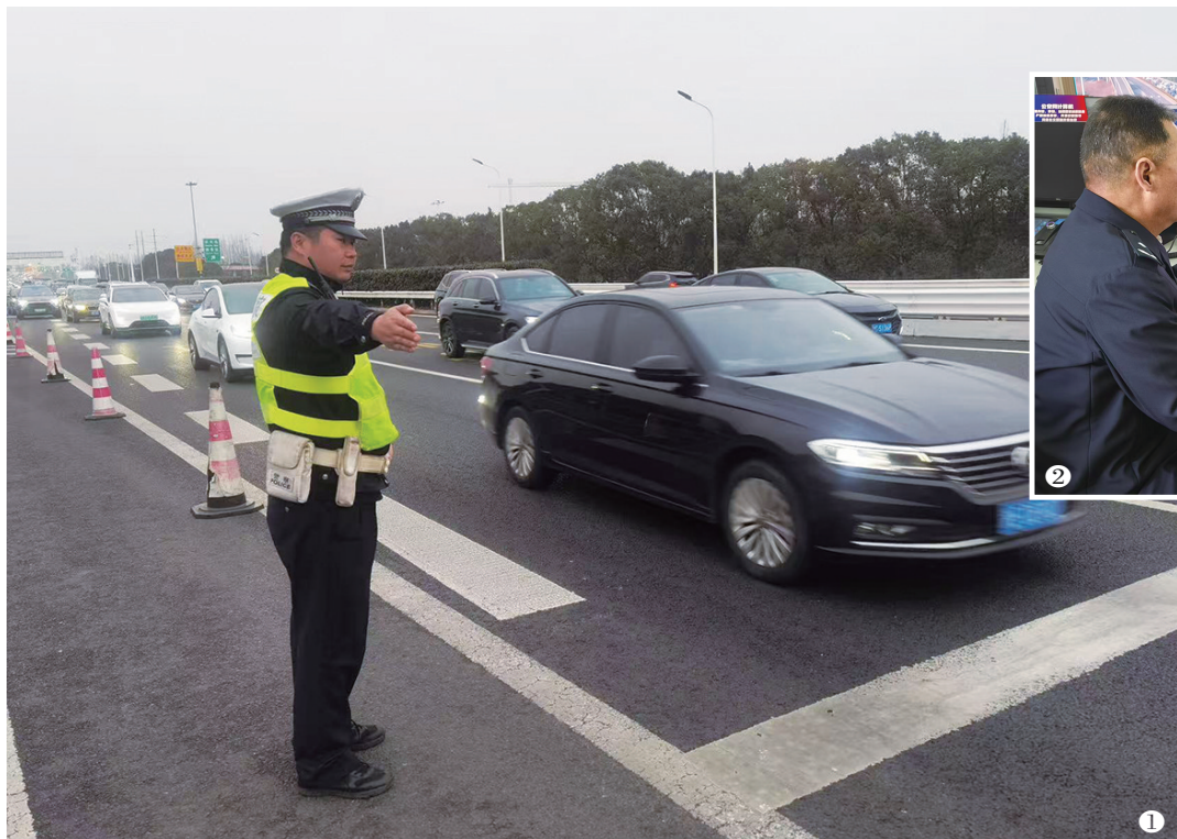
①金山警方实地疏导交通。