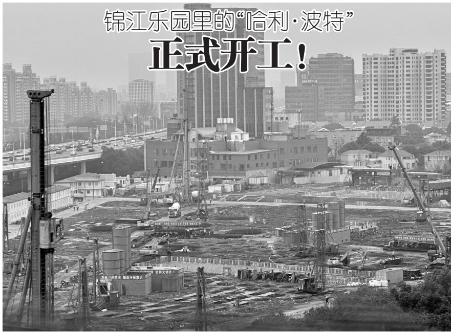
锦江乐园里的“哈利·波特” 正式开工!

为强化内部管理,办法明确儿童福利机构安全管理主体责任,并完善消防安全、应急管理、财务管理、档案管理、人员管理、捐赠管理等方面具体制度和监管要求。 据新华社电