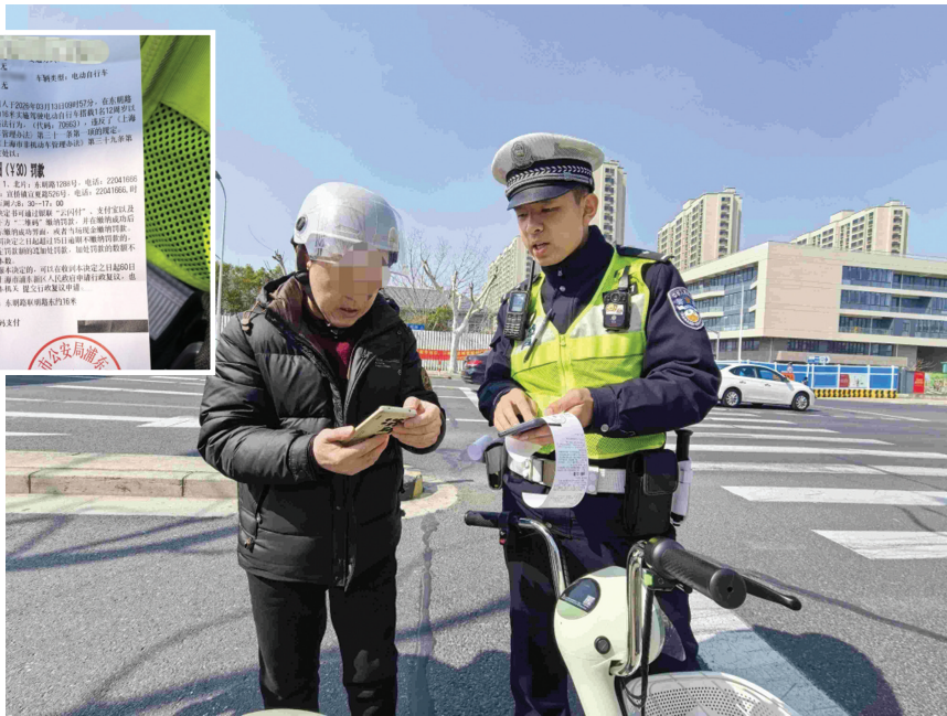
现场民警向违法当事人进行提示告知和解释说明。