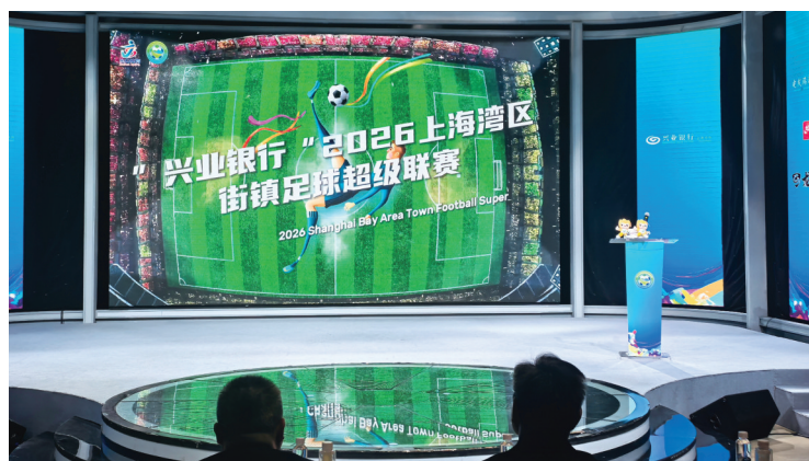
“湾区镇超”赛事发布会现场。