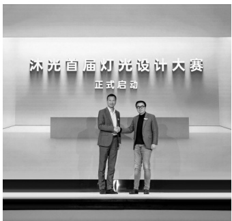
沐光首届灯光设计大赛。

性,大赛特邀Aldo Cibic、梁志天、王受之、郝洛西等九位国内外设计界、学术界领军人物,担任大赛评审及学院首批导师,汇聚全球顶尖设计与学术资源,评审维