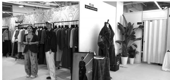
MODE上海服装服饰展于长宁全新地标晶耀虹桥启幕。

在琳琅满目的品牌矩阵中,长宁本土独立设计师品牌“在我zaiwǒ”凭借独特的美学语言,成为现场焦点。品牌以面料为画