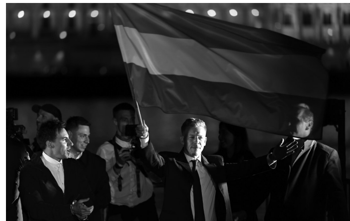
毛焦尔·彼得(中)在胜选晚会上挥舞匈牙利国旗。